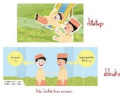
Gambar 5. Halaman 4