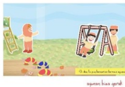
Gambar 7. Halaman 6