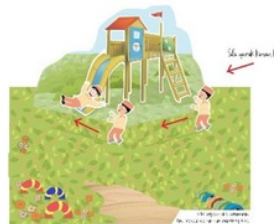
Gambar 4. Halaman 3