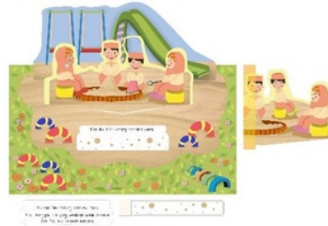
Gambar 2. Halaman 1