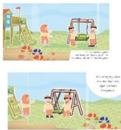
Gambar 6. Halaman 5