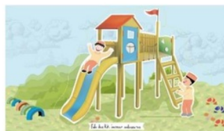
Gambar 3. Halaman 2