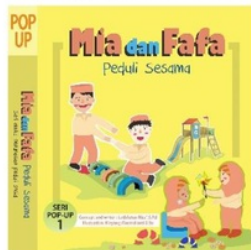
Gambar 1. Cover buku

Berikut gambaran desain rancangan buku cerita pop-up karakter peduli sosial: