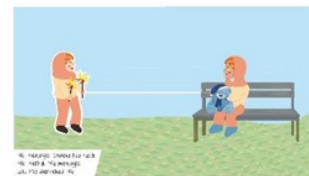
Gambar 8. Halaman 7